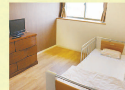
■居室 日当たり良く落ちついた雰囲気。機能的で心地よい空間となっています。