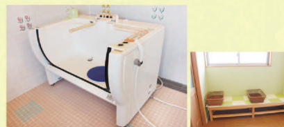
■浴室 一般浴以外にも座ったまま入ることができる座浴もあります。